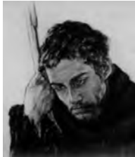
San Juan de Dios

«Jesucristo me traiga a tiempo y me dé gracia para que yo tenga un hospital, donde pueda acoger a los pobres desamparados y faltos de juicio, y servirles como yo deseo».