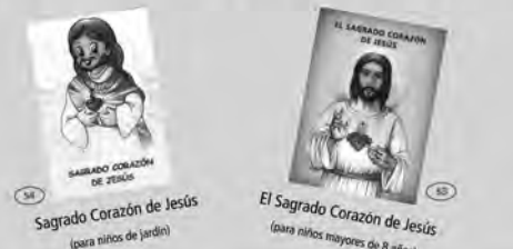
Sagrado Corazón de Jesús (para niños de jardín) El Sagrado Corazón de Jesús (para niños mayores de 8 años)