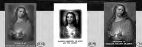
Novena al Sagrado Corazón de Jesús Sagrado Corazón de Jesús en vos confío Oraciones al Sagrado Corazón de Jesús