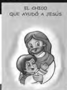
El chico que ayudó a Jesús

libros para los más chicos... ...para que se asomen al fascinante mundo de la Biblia