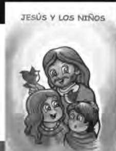
Jesús y los niños